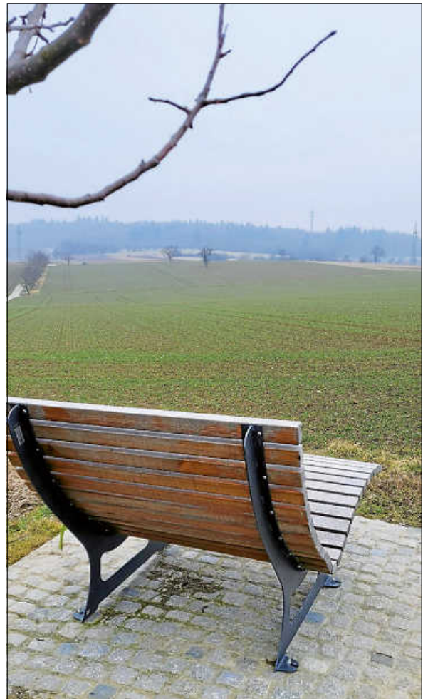
Eine Ruhebänk mit schöner Fernsicht nach Pforzheim.

Eure Wanderführer Roberto und Monika www.tveisingen.de