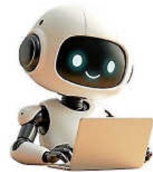
Grafik: TIVIO GmbH

Ab sofort steht der neue KI-Assistent TIVIO rund um die Uhr auf der Website www.eisingen-enzkreis.de zur Verfügung – sowohl am Computer als auch mobil auf Tablet oder Smartphone.