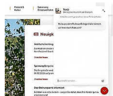
Das Chat-Fenster mit Eingabefeld unten und einem Senden-Button

Ab sofort finden Sie das Tivio Logo unten rechts auf unserer Homepage. Ein Klick darauf öffnet direkt das Chatfenster, so können Sie uns schnell und unkompliziert kontaktieren oder Fragen stellen.