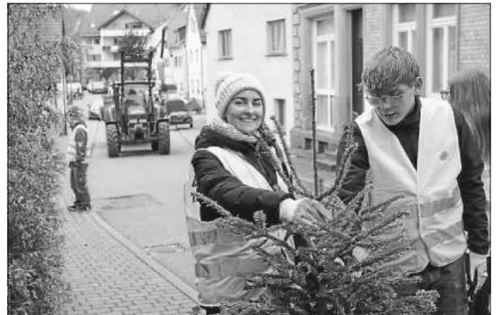
bei der Arbeit