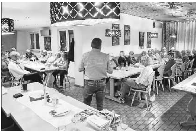
Aus der Mitgliederversammlung 2024

Termin vormerken: Mitgliederversammlung des OGV Eisingen am Samstag, 22. Februar um 19.00 Uhr in Bauer's Gaststätte.