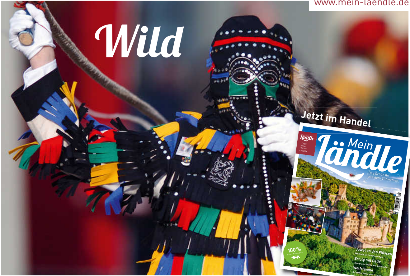
Die Summe der vielen, kleinen Besonderheiten Baden-Württembergs