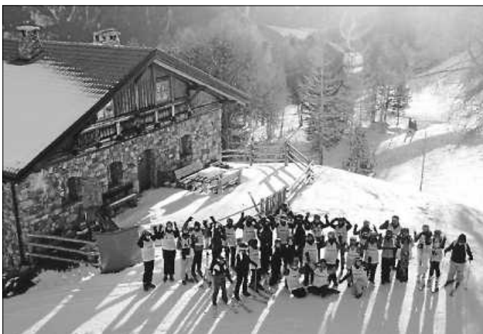
Schülergruppe vor der Haideralm

Ab Montag wartete bei schönem, meist sonnigem Winterwetter das Skigebiet Haideralm-Schöneben mit bestens präparierten Pisten auf alle Ski- und Snowboardfahrer. Während sich die Anfänger im Skikurs zunächst mit den Grundlagen vertraut machten und an den Übungshängen ihre ersten Abfahrten bewältigten, konnten die Fortgeschrittenen und Profis die Zeit auf den endlosen Pistenkilometern genießen. Die folgenden Tage fiel das Aufstehen trotz Muskelkater und Erschöpfung nicht schwer, denn schon frühmorgens wurden die Kinder und Jugendlichen vom herrlichen Bergpanorama geweckt. Binnen kürzester Zeit machten die Anfänger beeindruckende Fortschritte, fuhren technisch immer sicherer (von „Pizza zu Pommes“) und ließen sich vom Pistenfieber anstecken, während die Köhner unermüdlich dynamische Schwünge auf zügigen Abfahrten in den Schnee zauberten. Zur Mittagszeit kehrten die Schüler/innen mit ihren Lehrkräften täglich gemeinsam in eine Skihütte ein, um sich mit einer kleinen Zwischenmahlzeit wieder zu stärken und mit neuer Energie in den Nachmittag zu starten. Abgerundet wurden die Tage im Schnee mit einem abwechslungsreichen Abendprogramm, das von einem Infoabend zu den FIS-Regeln über eine Fackelwanderung im Schnee bis hin zu geselligen Spielerunden und einem Hüttenabend mit traditioneller Südtiroler Live-Volksmusik reichte.