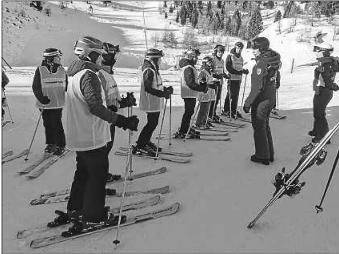
Die Anfänger beim Skikurs

Nach staufreier Busfahrt und sicherer Ankunft in St. Valentin auf der Haide musste bei eisigem Wind erst einmal das ganze Gepäck inklusive Skiern, Snowboards und Lebensmittel mit der Gondel direkt zur Unterkunft, der auf 2100 m Höhe gelegenen Berghütte Haideralm , transportiert werden. Dort wurden zunächst die Zimmer bezogen. Anschließend fuhr eine Schüler/innen erneut mit der Gondel ins Tal, um im ortsansässigen Sportgeschäft die voreingestellte Skiausrüstung auszuleihen.