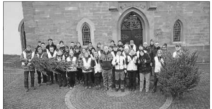
die fleißigen Helfer