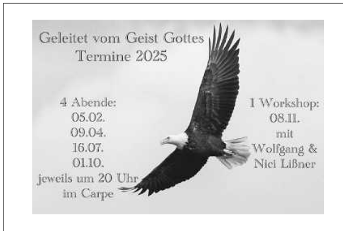
Plakat: Ev. Kg. Eisingen

Infos & Anmeldung unter: www.kirche-eisingen.de