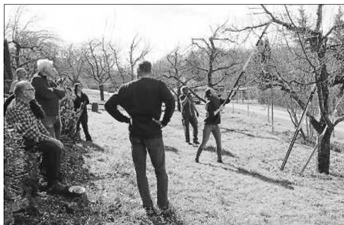
Selbst schneiden unter fachlicher Anleitung ist vorgesehen und natürlich erwünscht.