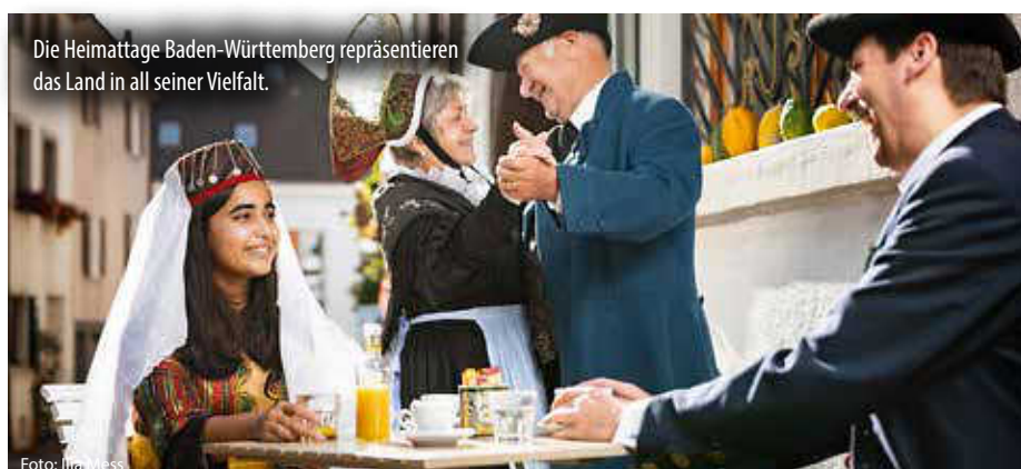
Die Heimattage Baden-Württemberg repräsentieren das Land in all seiner Vielfalt.