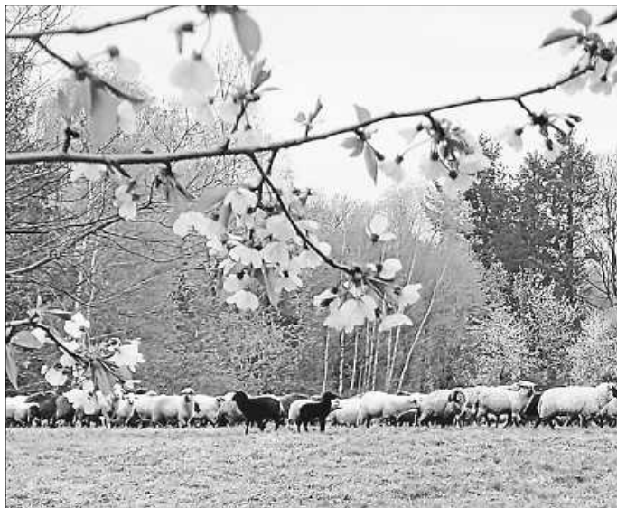
Frühlingserwachen in Langensteinbach