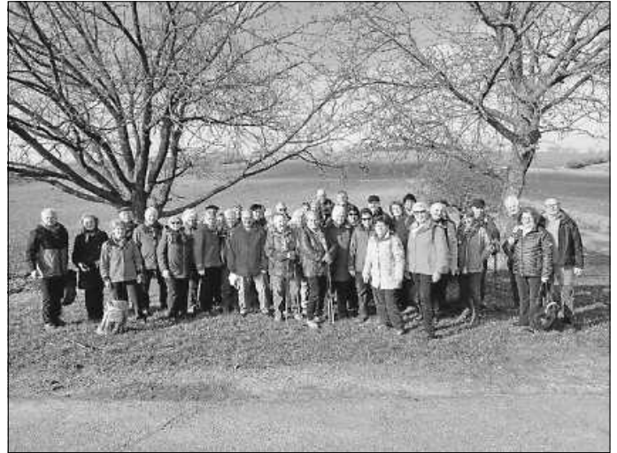
Wandergruppe unterwegs in Dürrenbüchig