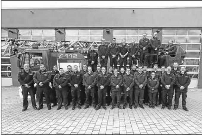
Strahlende Gesichter: 28 neue Führungskräfte wurden in Mühlacker von Ausbildern aus Enzkreis-Wehren und von Experten aus dem Landratsamt ausgebildet.