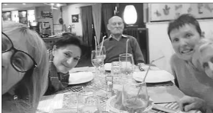
Treffen in San Polo