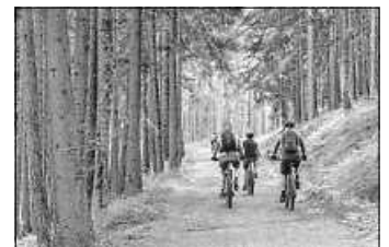
Eine Radtour mit Förster Bernd Obermeier zur Arbeit und den Spuren der Forstwirtschaft im Wald bietet das Forstamt des Enzkreises an.

Treffpunkt ist um 10 Uhr am Rathaus Ötisheim. Anmeldungen nimmt das Forstamt ab sofort per E-Mail an forstamt@enzkreis.de gerne entgegen. (enz)