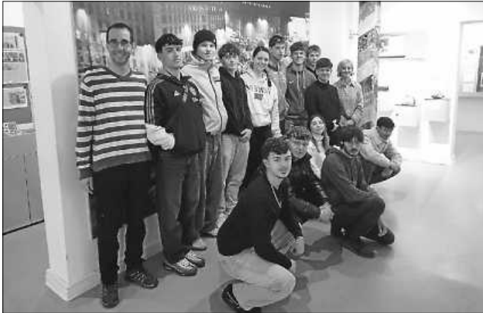
Schülergruppe im Pforzheimer DDR-Museum