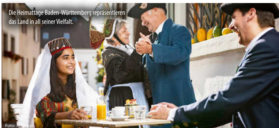
Die Heimattage Baden-Württemberg repräsentieren das Land in all seiner Vielfalt.