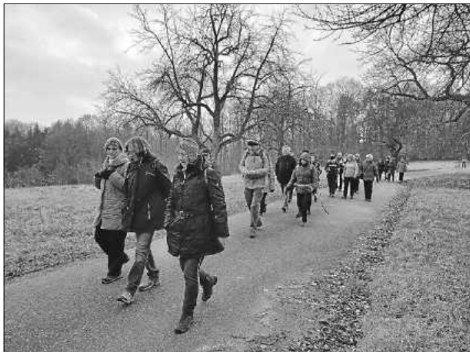
Wanderung am Aalkistensee