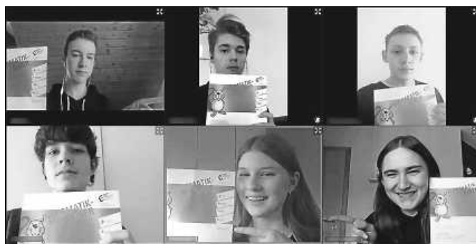
Erfolg trotz Pandemie: Diese sechs Schüler des Königsbacher Gymnasiums haben beim „Informatik-Biber“ einen ersten Preis gewonnen. Die Urkunde bekamen sie per Post.

im Mittelpunkt steht, werden bei dem Wettbewerb kleine Preise verliehen. Vor einigen Tagen sind sie am Königsbacher Gymnasium eingetroffen. Den sechs Erstplatzierten hat Klein sie per Post zugeschickt. „Es ist für die Schüler einfach motivierend, etwas in der Hand zu haben.“ In einer Videokonferenz sagte Klein ein paar lobende Worte. Anschließend wurde ein Foto als Screenshot gemacht. Zwar sei das ganz anders gewesen als in den Vorjahren, in denen die Preise immer persönlich in der Schule übergeben wurden. Aber Klein sagt trotzdem: „Ich fand das sehr gelungen.“ Die zwölf Zweitplatzierten bekommen ihre Preise von den Lehrern, wenn der Präsenzunterricht wieder startet. Erst vor kurzem wurde das Königsbacher Gymnasium bereits zum vierten Mal in Folge als MINT-freundliche Schule ausgezeichnet. Seit vorigem Schuljahr gibt es das Fach Informatik-Mathematik-Physik, kurz IMP. Zusammen mit dem bereits an der Schule existierenden Fach Naturwissenschaft und Technik (NwT) soll es zur Stärkung des naturwissenschaftlichen Profils dienen. – Nico Roller