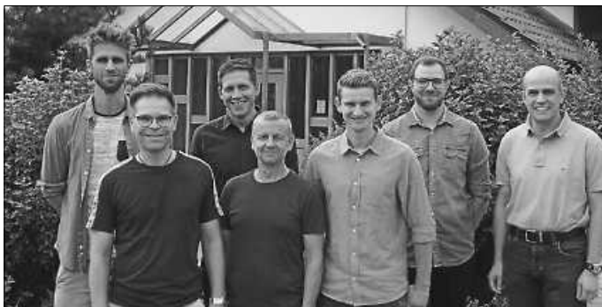
Vorstand CVJM Eisingen