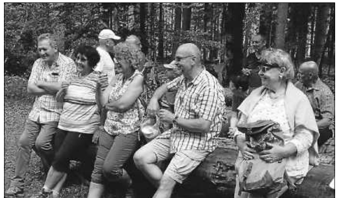
Versperrpauze im Eyachtal

Rucksackverpflegung ist vorgesehen sowie eine Schlusseinkehr am Ende der Wanderung. Bitte den Mundschutz nicht