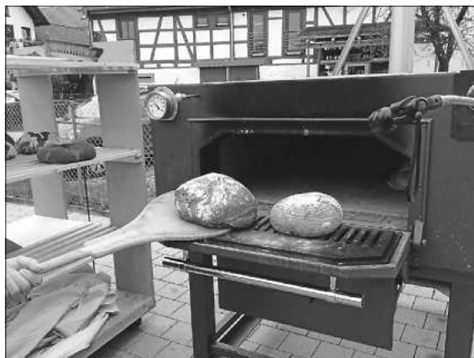
Brot aus dem Holzbackofen