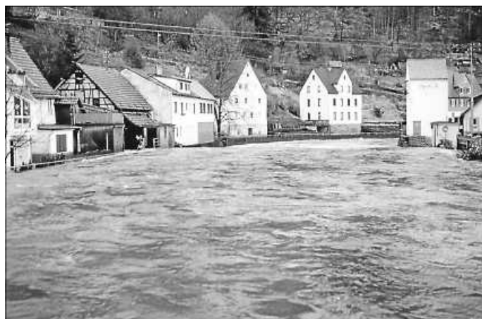
In der Region unvergessen: Das Enz-Hochwasser von 1993.

„Bürgerinnen und Bürger können sich gerne anschließen und ebenfalls spenden“, sagt Rosenau (Spendenkonto „Hochwasserhilfe Enzkreis“, IBAN DE86 6665 0085 0008 2139 68). Für Hilfsangebote in Form von Sachleistungen oder personeller Unterstützung haben das Land Rheinland-Pfalz sowie der besonders stark betroffene Landkreis Ahrweiler eigene E-Mail-Adressen eingerichtet: Hochwasserhilfe@add.rlp.de und Hochwasserhilfe@kreis-ahrweiler.de. (enz)