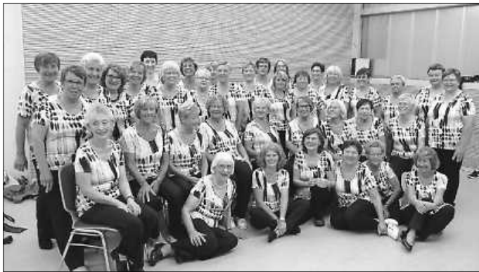
Das waren noch Zeiten - Turngala 2016 - Hoffen wir doch, dass es solche Tage weiterhin geben wird

Zeit freut sich ganz besonders eure Übungsleiterin Irene https://www.tveisingen.de/programm/fitness-gesundheit/frauen-gymnastik/