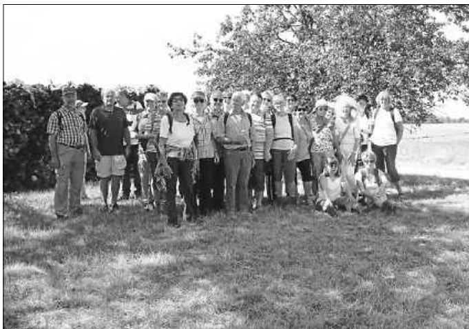
Wanderung in Freudenstein 2019

https://www.tveisingen.de/programm/natursport/wandern/