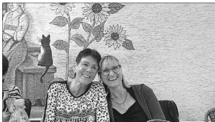
Zwei, die sich gut verstehen