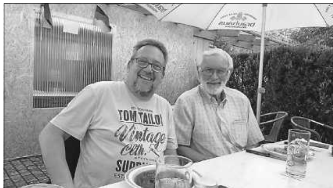
Die „Chefs“ unter sich

im Gasthaus Adler in Eisingen vorgesehen. Aus mehreren Gründen konnte im Sommer/Herbst kein gemeinsamer Termin gefunden werden. Und dann kam der Lockdown und es ging gar nichts mehr.