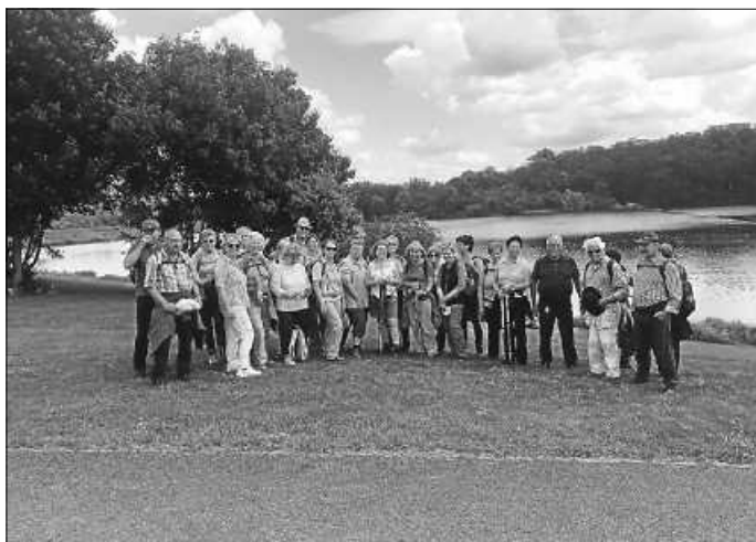
Die Wandergruppe im Zabergäu 2019