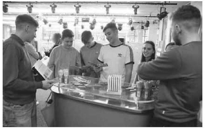
Die Auszubildenden der Firma Leicht + Müller beantworten die individuellen Fragen der Schüler/innen der Klasse 9d.

Die Schüler/innen erhielten neben den zahlreichen Informations- und Anschauungsmaterialien auch konkrete Vorstellungen der vielfältigen Berufsangebote sowie Denkanstöße für ihre Zukunft und gewannen neue Erkenntnisse bezüglich ihrer Berufswahl. Besonders erfreulich war auch zu sehen, dass einige ehemalige Schüler/innen nun als Auszubildende unmittelbar den Besuchern von der Berufswelt berichteten und zum Teil ihre eigenen Werkstücke präsentierten.