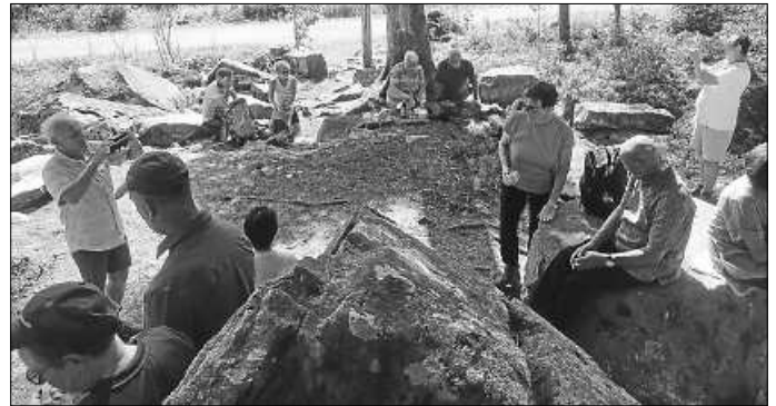
Bei der Vesperpause am Volzemerstein