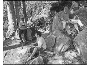
Bei der Vesperpause am Volzemerstein