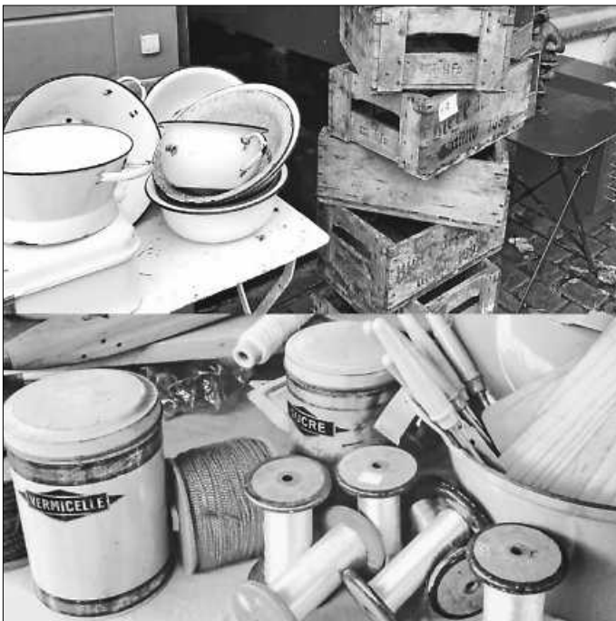
Text und Bild: Stephanie Nonnenmann-Schickel