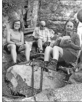
Bei der Vesperpause am Volzemerstein