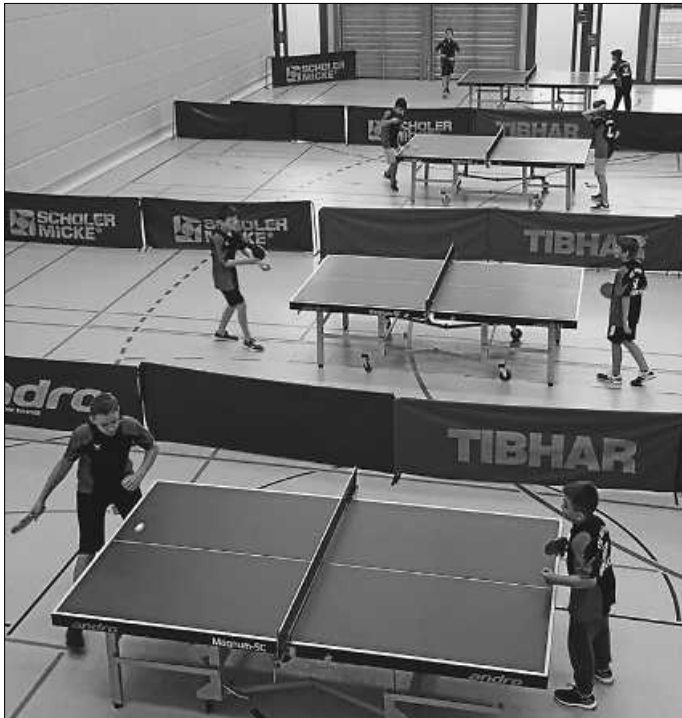
Trainingsbetrieb Schüler und Jugend