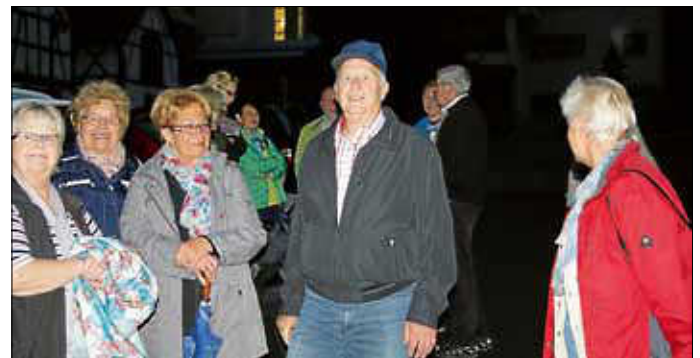
Kurz vor der Abfahrt frühmorgens...

Der Kostenbeitrag für die Reise beträgt € 80,-/Person bei Unterbringung in Gastfamilien. Stand heute sind noch Busplätze frei. Zu gegebener Zeit werden wir den Teilnehmern die Kontonummer für die Überweisung des Fahrtkostenanteils bekanntgeben. Nachstehend noch ein paar Fotos vom Treffen (25 Jahr-Feier) 2015 in San Polo.