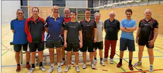
Teilnehmer der Vereinsmeisterschaft des TTC