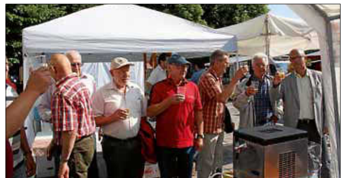
Nach dem Zeltaufbau – Faßanstich!

Wir freuen uns auf weitere Anmeldungen! Bis zum nächsten Mal... Ute Lutz, FiB-Geschäftsstelle Eisingen, Tel.: 07232-383023