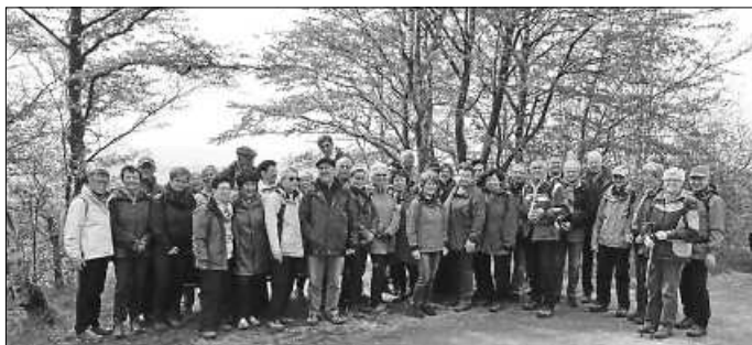
Die Wandergruppe in Rosswag