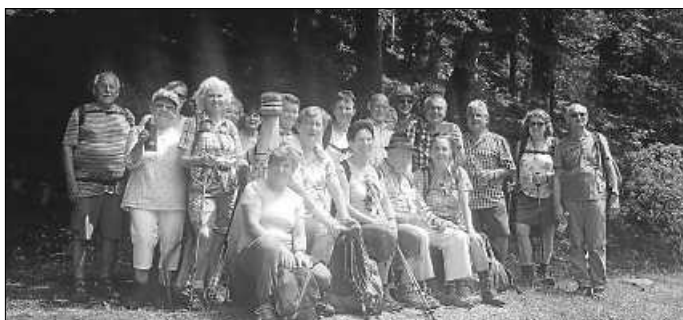
Bei der Wanderung in Bad Teinach