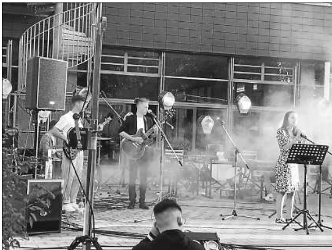
Schulband beim Abschluss 2020.

Den Abschluss bildeten die klassenweise Verlesung der Namen der erfolgreichen Absolventen und die Nennung der Lob- und Preis-Schüler/-innen bevor auf Klassenebene die Zeugnisse ausgegeben wurden. So endete mit Sonnenuntergang eine Zeugnisübergabe der anderen Art und im nächsten Jahr schaffen wir es auch, dass der Videostream nicht nach der Hälfte der Zeit in die Knie geht! Aber es gab dafür den kompletten Stream als Filmdownload für alle, die nicht live dabei sein konnten.