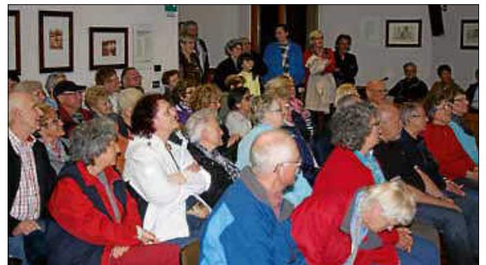
Empfang der Eisinger Delegation im Rathaus von San Polo