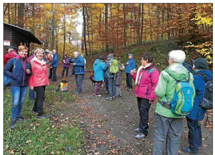
Abschlusswanderung in Grünwettersbach

https://www.tveisingen.de/programm/natursport/wandern/