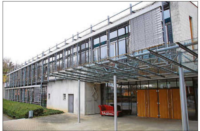
Das Bestehende nutzen will man bei der Erweiterung des Königsbacher Bildungszentrums: Der bisherige Bau für die Naturwissenschaften soll im Norden erweitert werden. Wann mit den Arbeiten begonnen wird, steht nun vorerst in den Sternen. (rol)

Zu Buche schlagen soll die Erweiterung mit rund 7,5 Millionen Euro, inklusive Baunebenkosten. Im aktuellen Haushaltsplan sind schon rund 1,1 Millionen Euro eingestellt, die von den Verbandsgemeinden über eine Kapitalumlage gestemmt werden. Weil ab 2021 zur Finanzierung des Erweiterungsbaus auch Kreditaufnahmen vorgesehen sind, wird künftig eine Verpflichtungsermächtigung in Höhe von rund 6,6 Millionen Euro nötig. Auch dafür hat die Versammlung bereits erste Weichen gestellt, indem sie die Verwaltung damit beauftragte, die Verbandssatzung so zu ändern, dass eine Kreditfinanzierung rechtlich möglich wird. In den vergangenen Monaten hat die Verbandsverwaltung zusammen mit den Schulleitungen, dem Architektenbüro und den Fachplanern die Planungen vorangetrieben, damit der Neubau den beiden Schulen zum geplanten Fertigstellungstermin im Schuljahr 2022/2023 zur Verfügung steht. Ob das tatsächlich klappen kann, ist durch die Corona-Pandemie nun fraglich geworden. – Nico Roller