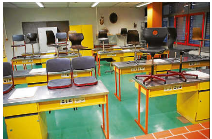
Aus den 1970er-Jahren stammen die meisten Fachräume im Hauptgebäude des Königsbacher Bildungszentrums. Sie sind sanierungsbedürftig. (rol)