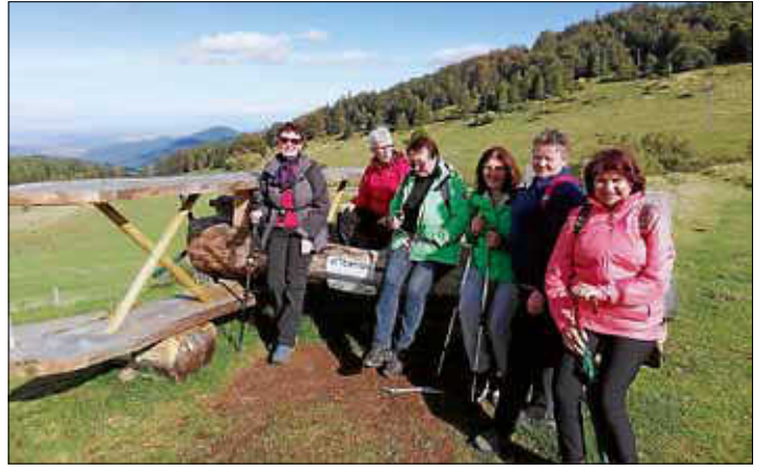
Auch die Tour zur Hoch-Königsburg konnte trotz anfänglich schlechten Wetters durchgeführt werden: