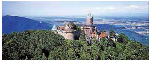
Bei der Tour „Trois-Chateaux“ hatten wir noch Zeit einen Abstecher in das wunderschöne Equisheim zu machen:

Kommt ruhig vorbei und jeder darf zuschauen und sich mitbewegen! Ich freue mich auf Euch! Eure Ulrike Haag