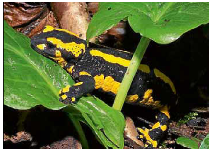
Feuersalamander auf dem Weg zu seinen Laichgewässern